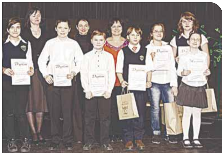
Laureaci w Kategorii klas IV-VI i gimnazjum