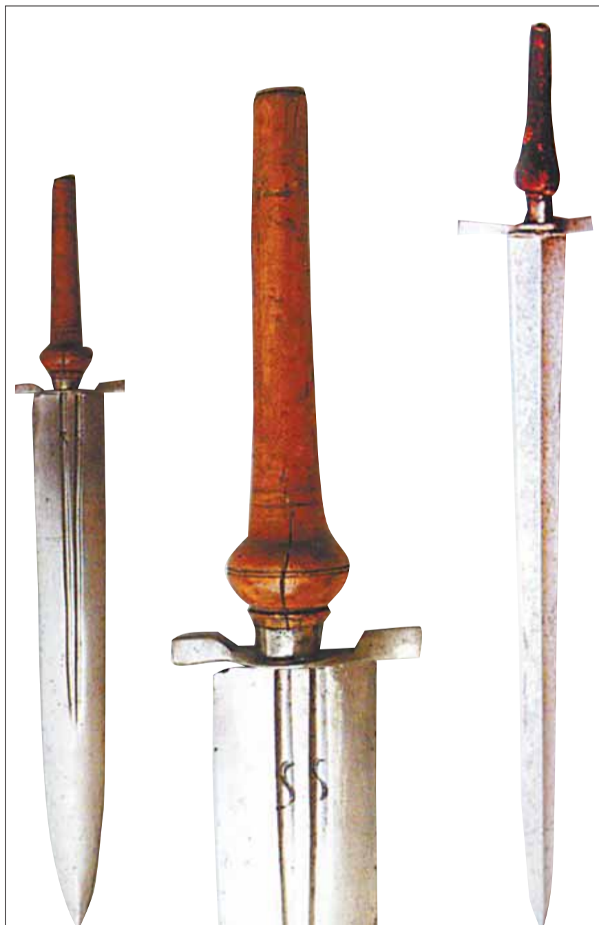
Bagnety szpuntowe przechowywane w Muzeum Wojska Polskiego przeznaczone prawdopodobnie do celów myśliwskich – nr inw. MWP 660* oraz dłuższy od niego – nr inw. MWP 50902