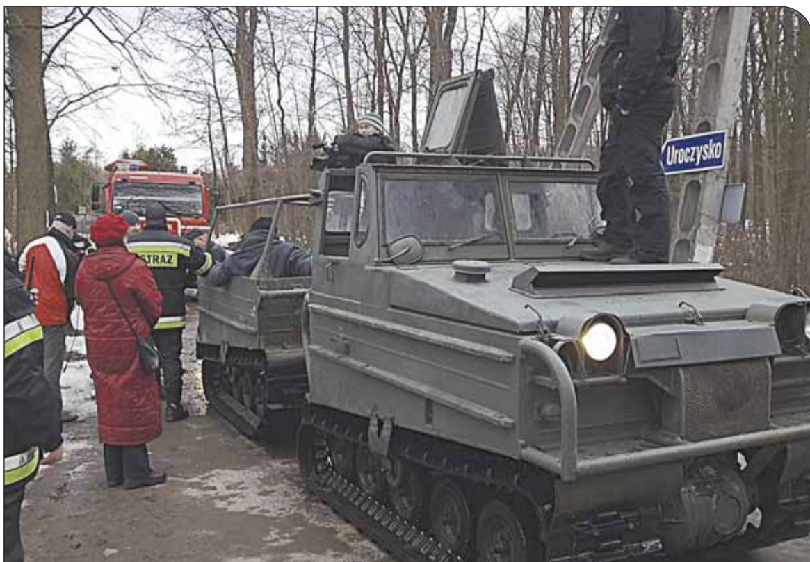
Akcja na Uroczysku