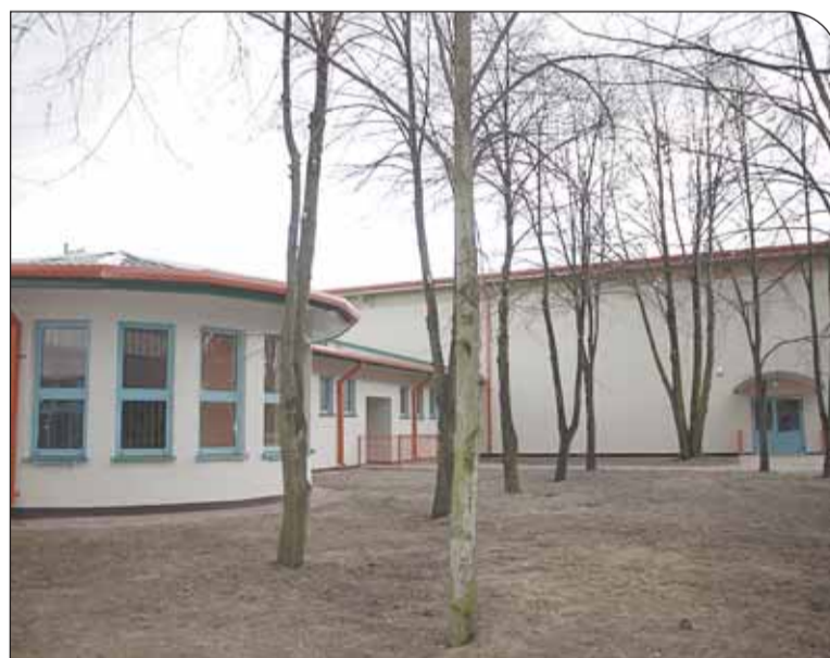
Szkoła Podstawowa w Józefowie

aktywne uprawianie sportu przez cały rok. Przy szkole powstaną dwa boiska sportowe – piłkarskie i wielofunkcyjne, do koszykówki i piłki siatkowej, ze sztuczną nawierzchnią, ogrodzone, z zamontowanymi piłkochwytnymi. W budynku stanowiącym zaplecze znajdują się m.in.: magazyn sprzętu, szatnie, sanitariaty, pomieszczenie dla trenera. Założenia rządowego programu przewidują zatrudnienie trenera - animatora, który sprawuje nadzór nad korzystaniem z obiektu i działalnością sportową. Cały kompleks zostanie oświetlony, aby można było z niego korzystać do późnych godzin. Bu-