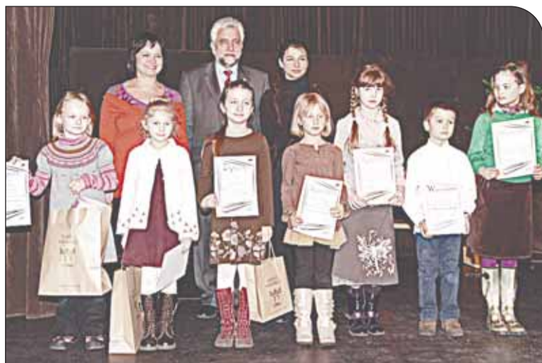
Laureaci w kategorii klas 0-III

11 marca Gminny Ośrodek Kultury w Nieporęcie gościł uczniów, podczas gminnych eliminacji konkursu recytatorskiego „Warszawska Syrenka”.