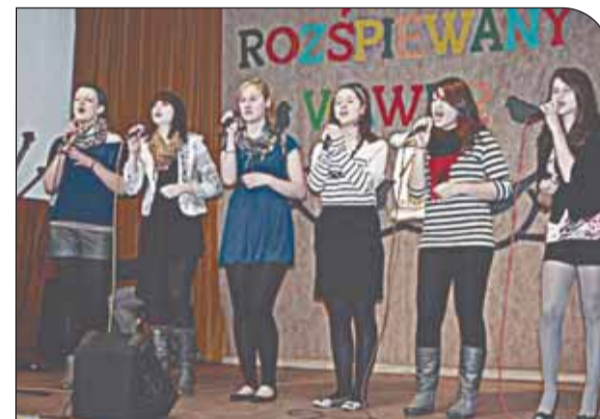
Występ Studia Piosenki