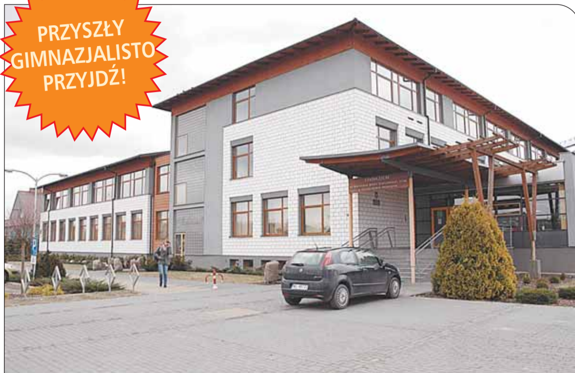
Gimnazjum w Stanisławowie Pierwszym