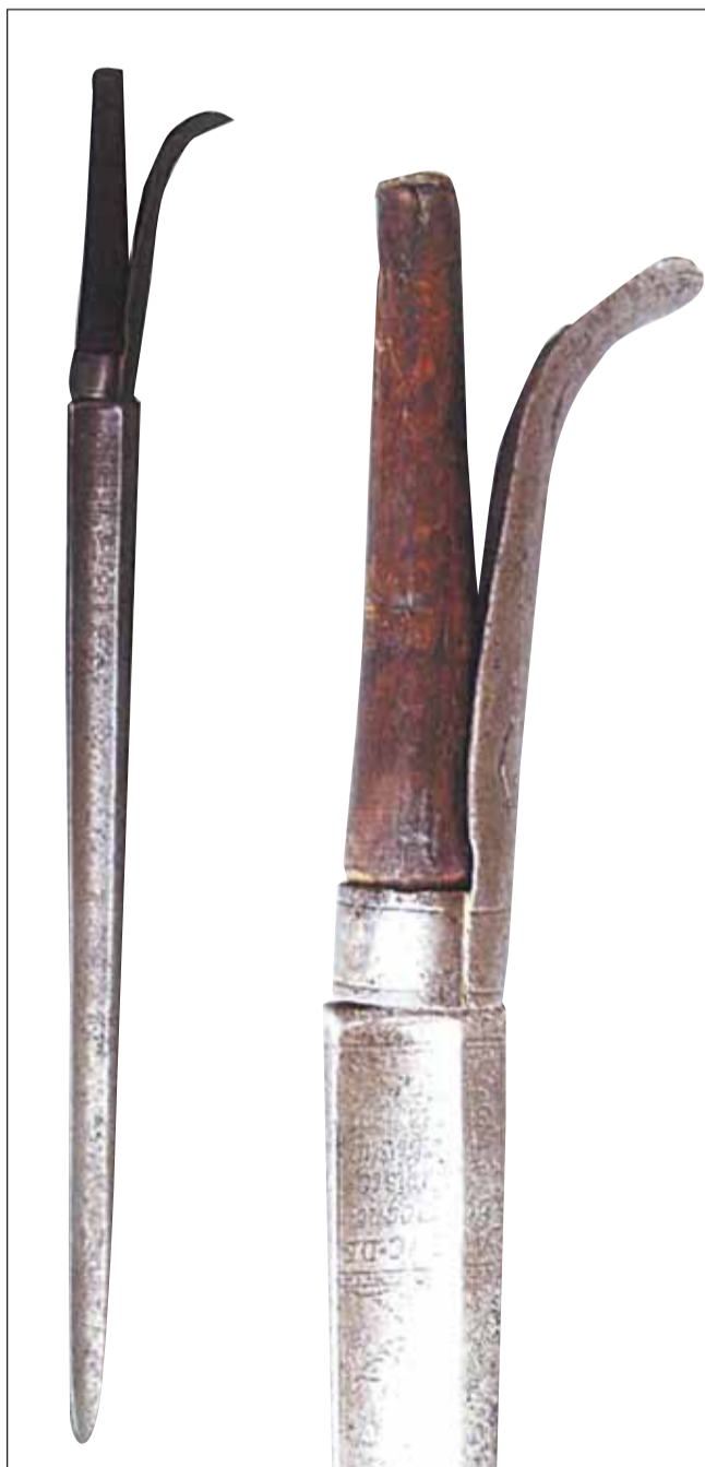
Francuski bagnet szpuntowy przeznaczony zapewne do celów wojskowych, ze sprężyną położony w lufie. Ekspонат w Muzeum Wojska Polskiego – nr inw. MWP 51263*

Serdecznie zapraszamy wszystkich mieszkańców Gminy Nieporęt do współtworzenia kolumny „Ocalić od zapomnienia” i dzielenia się zapomnianymi opowieściami i materiałem zdjęciowym. Kontakt z redakcją 22 767 04 10 lub drogą mailową d.wrobel@nieporęt.pl